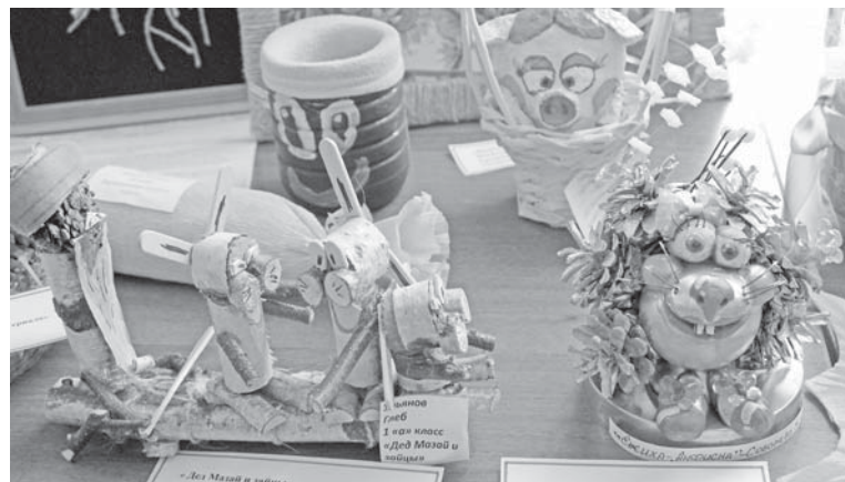
Полосу подготовила Ирина МИРОНОВА, фото Андрея ПЕРЕПЕЛКИНА

Научно-практическая конференция в очередной раз подтвердила, что экологические проблемы не знают государственных границ и природных рубежей – они глобальны. И только зная законы и тайны природы, можно стать ее верными друзьями и помощниками. Общей песней, фото на память и чаепитием завершился важный ежегодный форум школьников.