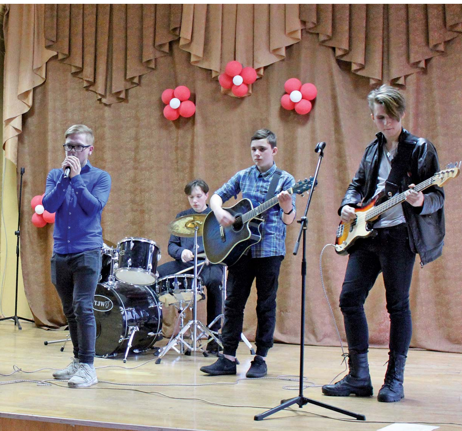
меров для школьников. Юные зрители были в восторге и подпевали исполнителям. А затем концерт плавно перешёл в школьную дискотеку.