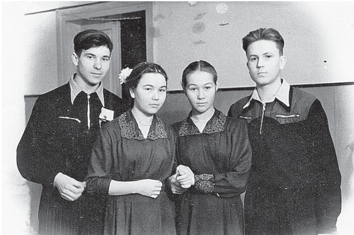
На снимке участники турпохода.

Вся наша группа перешла в 10-й класс. Пора в поход.