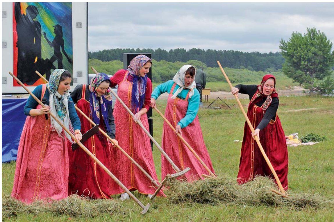
Нашим красавицам к лицу и русский наряд, и грабли.